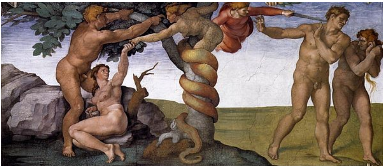
Michelangelo Buonarroti 1510 "La cacciata dal paradiso terrestre", affresco 280 x 570